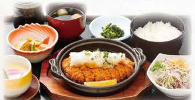
みぞれカツ定食 160g 909円 税抜 1,000円(税込)