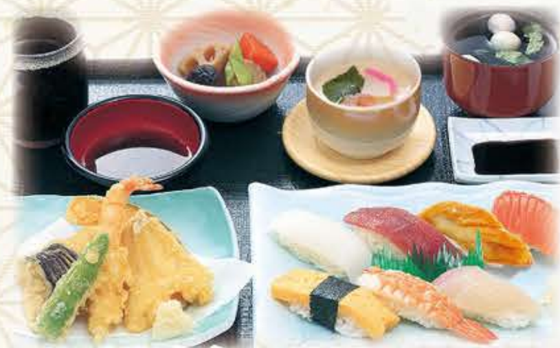
にぎり定食 1,180円 税抜 1,298円(税込) ※にぎり寿司は全てわさび抜きです。横にわさびを添えています。