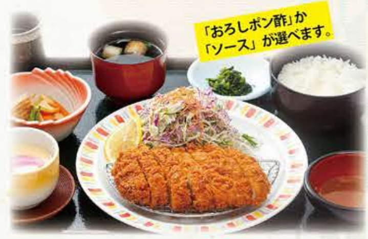
厚切りカツ定食 909円 税抜 1,000円(税込) 160g