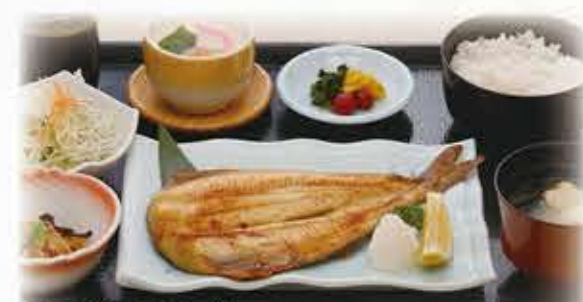
焼魚定食 (さば) 880円 税抜 968円(税込) (ほっけ) 909円 税抜 1,000円(税込)