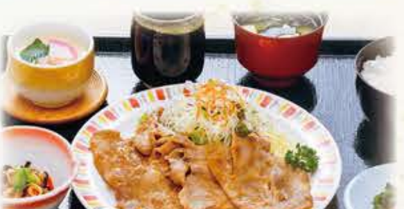
生姜焼き定食 909円 税抜 1,000円(税込)