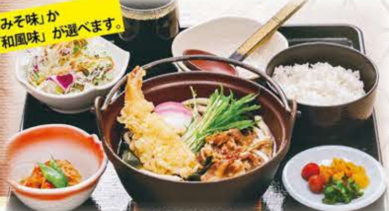
鍋焼うどん 880円 税抜 968円(税込)