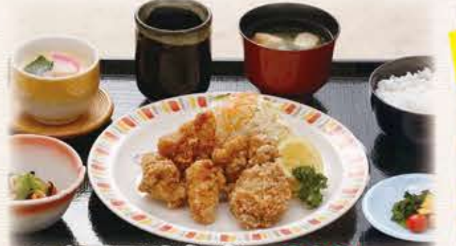
からあげ定食 880円 税抜 968円(税込)