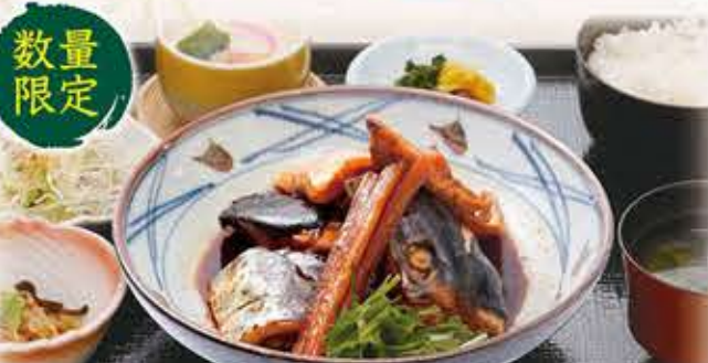
魚のあらだき定食 1,280円 税抜 1,408円(税込)