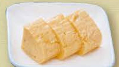
たまご焼 +100円 税抜 110円(税込)