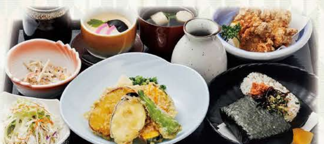
さんぞくや名物定食 (コムスピ、骨なし唐揚、揚出しトーフ) 1,280円 税抜 1,408円(税込)