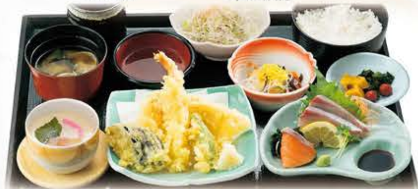
天刺定食 1,180円 税抜 1,298円(税込)