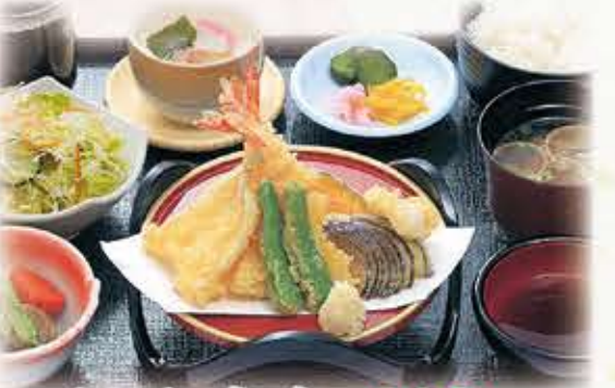
天ぷら定食 909円 税抜 1,000円(税込)