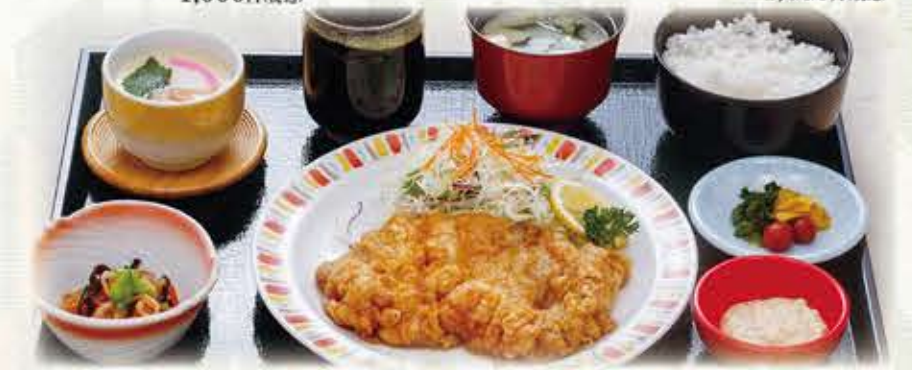
チキン南蛮定食 909円 税抜 1,000円(税込)