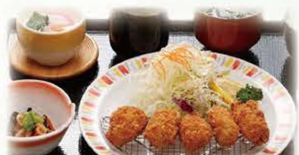
カキフライ定食 909円 税抜 1,000円(税込)