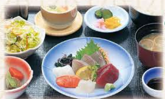
刺身定食 1,380円 税抜 1,518円(税込)