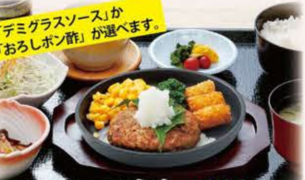
ハンバーグ定食 909円 税抜 1,000円(税込)