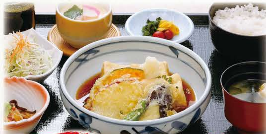
人気メニュー! 揚出しトーフ定食 909円 税抜 1,000円(税込)